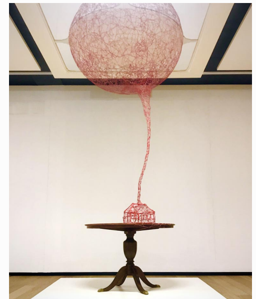
Zachte Landing, 2022