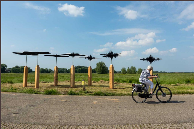
On The Line, 2020

Voor de IJsselbiënnale 2020 maakte Marianne 'On The Line', zeven sculpturen van een skyline samengesteld van bekende gebouwen in IJsselsteden, waarbij het water van de IJssel van laag naar hoog gaat en de skyline langzamerhand opneemt. 'Het werk bestond gedeeltelijk uit textiel, dus is een deel al vergaan. Jammer, maar het moiré effect van overlappende lappen, dat de vlakken doet bewegen als je er onderdoor loopt, kon ik alleen met textiel goed bereiken. Daar doe ik geen concessies aan.'